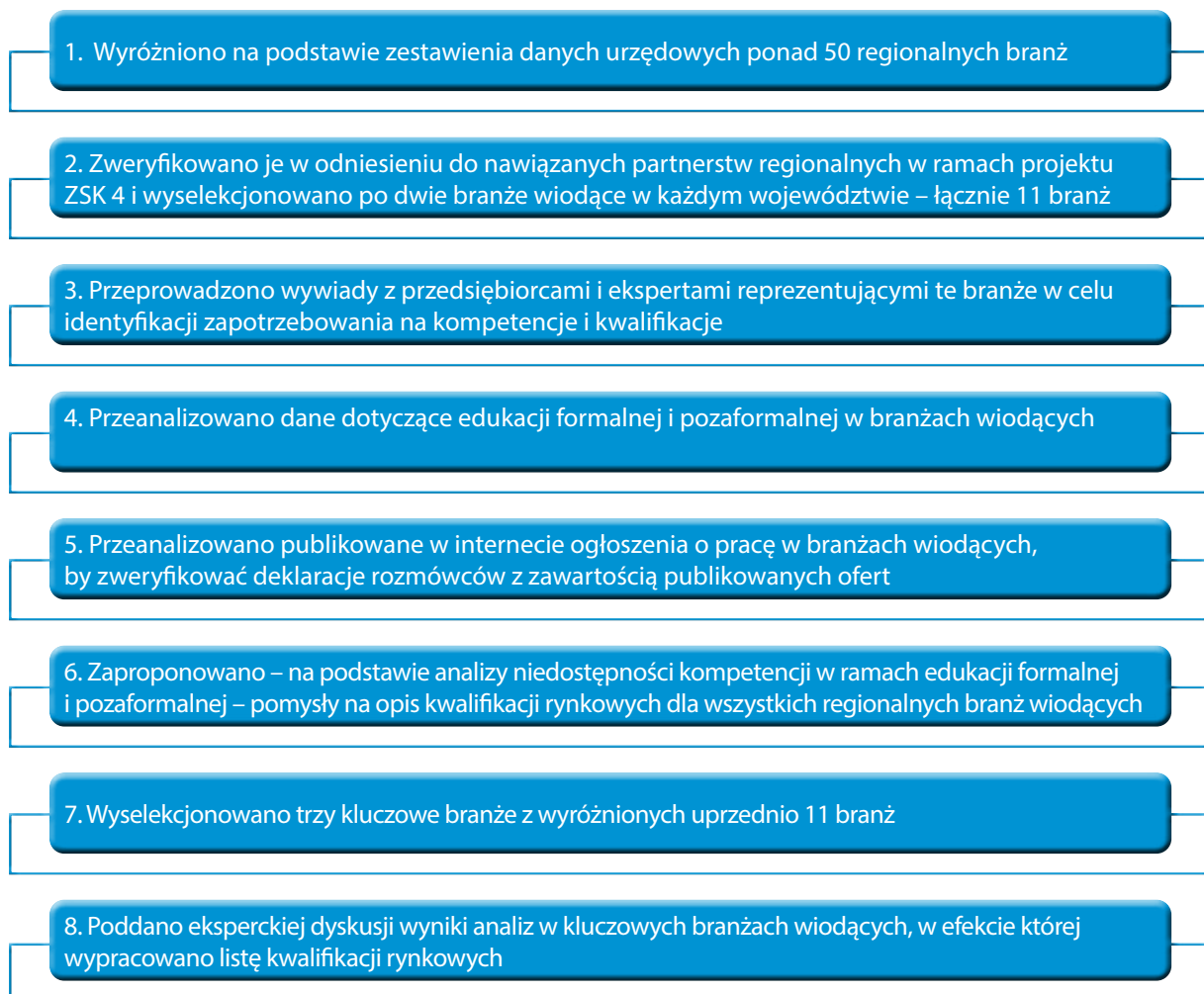
Schemat 1. Zarys procedury badawczej

Ogólny model całego projektu prezentuje schemat 1.